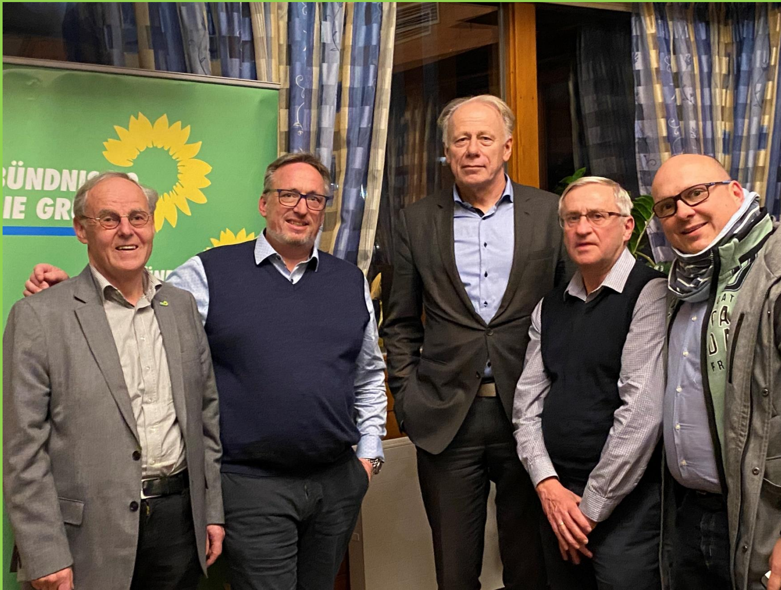
7. Grünkohlessen – Jürgen Trittin