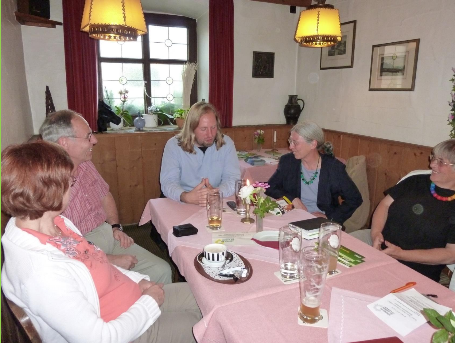
1. Grünkohlessen – Toni Hofreiter