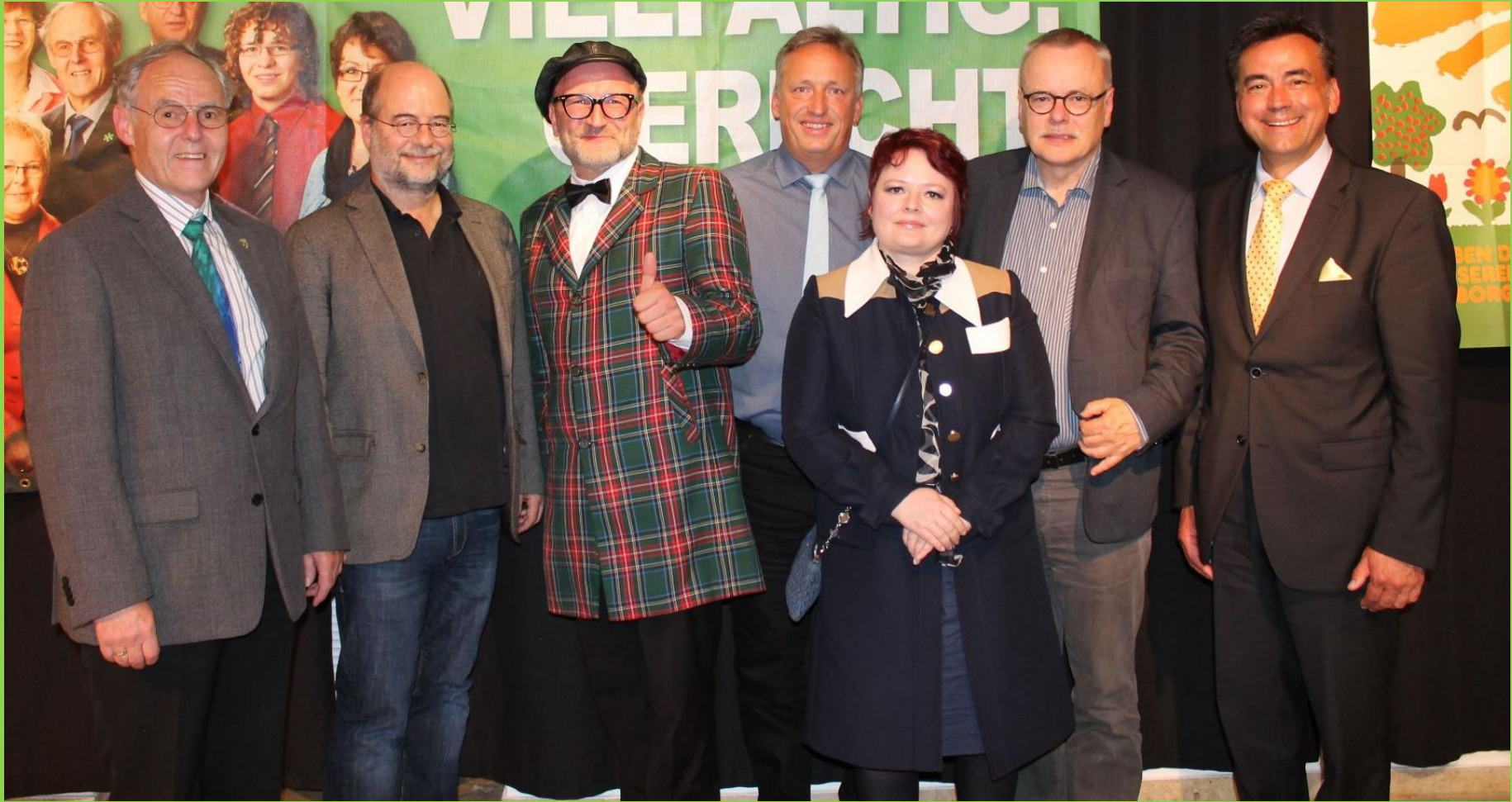
Jubiläumsveranstaltung 20 Jahre OV Schwanstetten